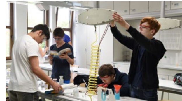
Neue naturwissenschaftliche Räume im Gymnasium bei St. Stephan

An reinen Grundschulen kann beispielsweise nur die Schulbücherei, der Werk-/Textilraum und der EDV-Raum neu eingerichtet werden, an Gymnasien kommen die kompletten naturwissenschaftlichen Fachräume hinzu.