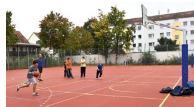
Neue Sportanlagen in der Heinrich-von-Buz-Realschule

Für den Sportunterricht und die Freizeitgestaltung werden moderne Außensportanlagen wie Hartplatz, Laufbahn oder Rasenspielfeld geschaffen. Ansprechend gestaltete Pausenhöfe machen den Schulalltag angenehm.