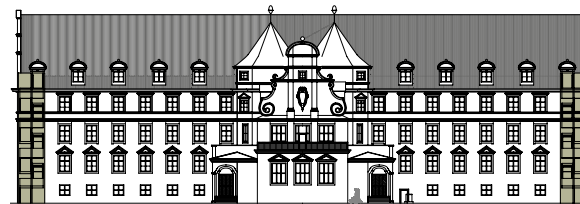
Ansicht Norden – saniertes Schulgebäude

Hans-Adlhoch-Grund- und Mittelschule Sanierung und Modernisierung