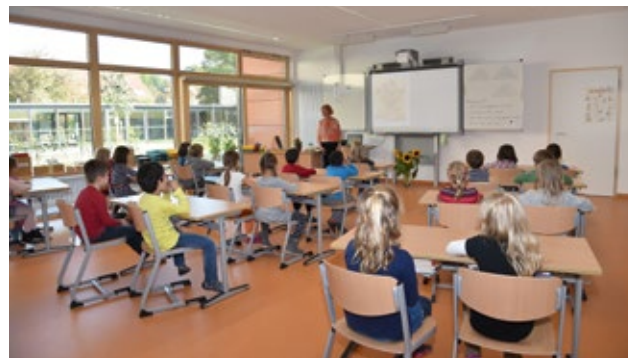
Klassenzimmer in der Grundschule Göggingen-West

Ein Großteil der Investitionen wird, auch hinsichtlich der Energieeffizienz, für die Erneuerung von Fenstern, Türen und Böden verwendet. Weitere Maßnahmen sind die Sanierung von Dächern und Fassaden, der Austausch maroder Leitungen sowie die Schaffung oder Verbesserung von Räumen.