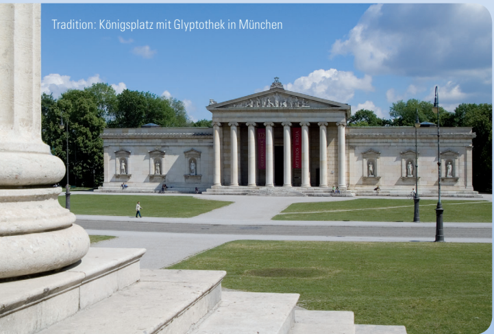
Tradition: Königsplatz mit Glyptothek in München

Dies hilft, Wesentliches vom Unwesentlichen zu unterscheiden und den Überblick in der Informationsfülle unserer Zeit zu bewahren.